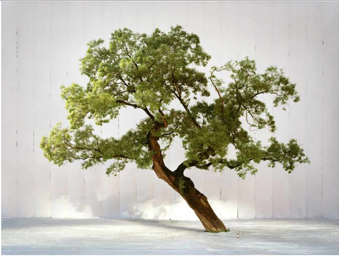
선원전 영역 회화나무 사진 1