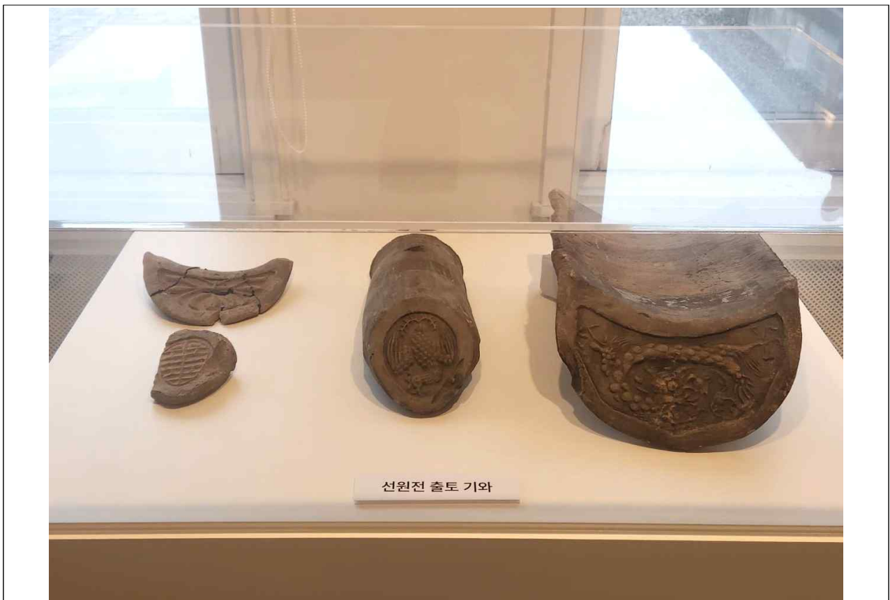
선원전 출토 기와