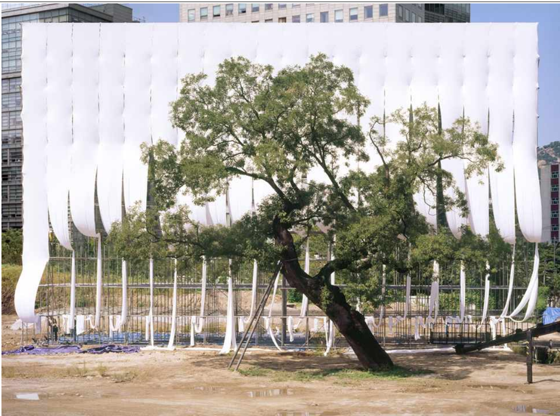
선원전 영역 회화나무 사진 2