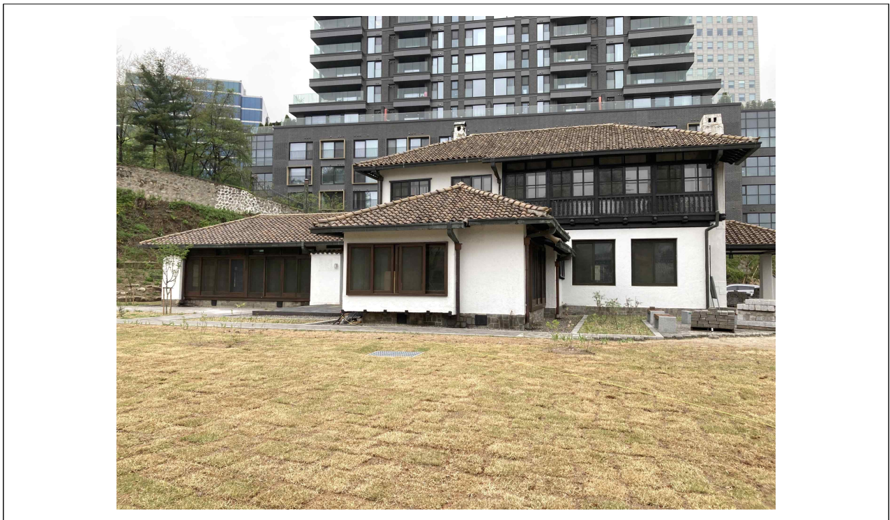
덕수궁 선원전 영역 내 '구(舊) 조선저축은행 중역사택'