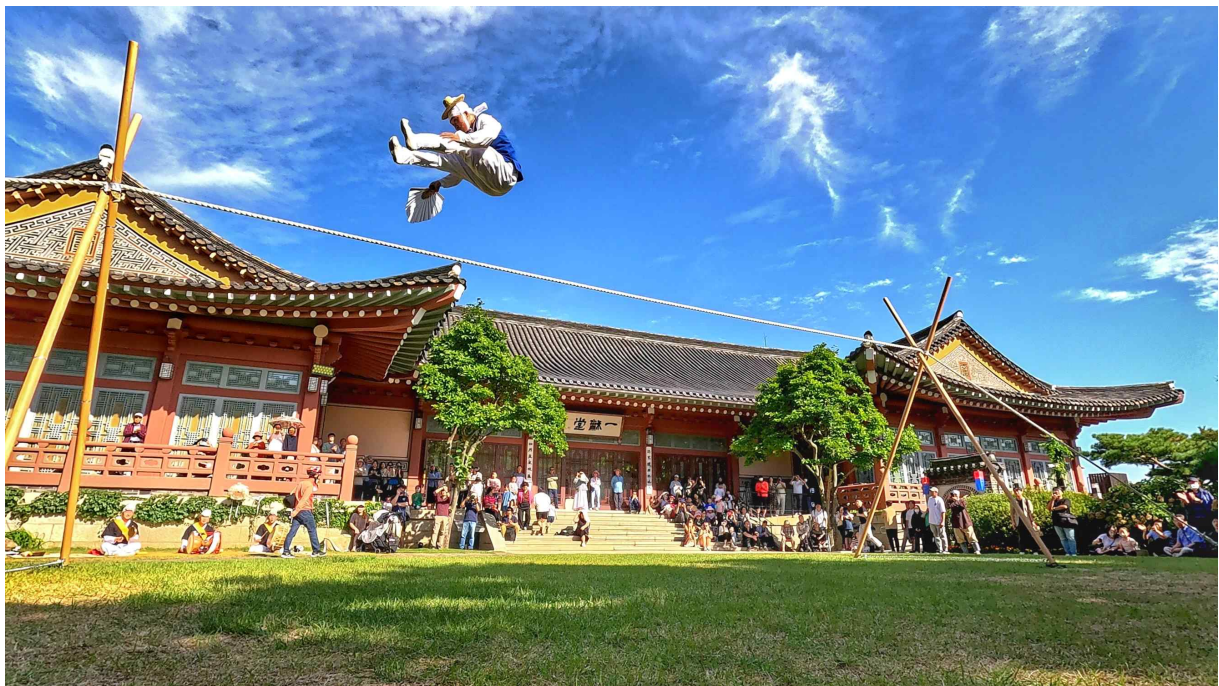
< 전통문화공연(예시) >