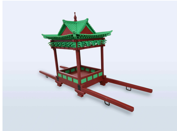
< “신여”와 “향용정” >