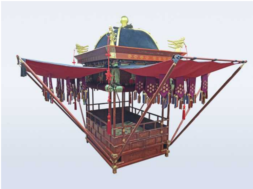
< “신연” >