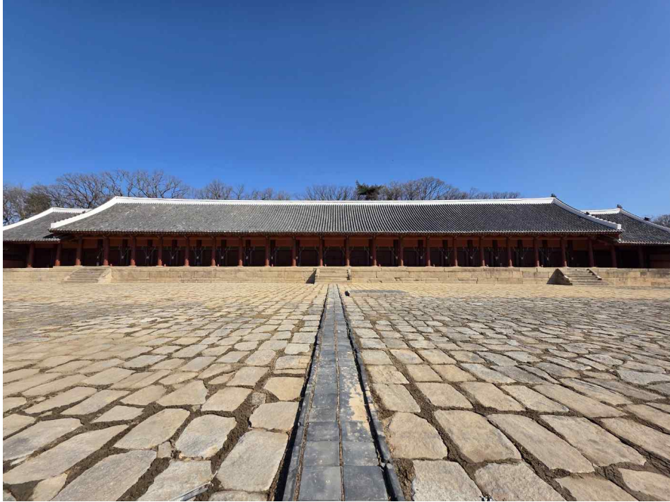
< 수리 완료된 종묘 정전 전경 >