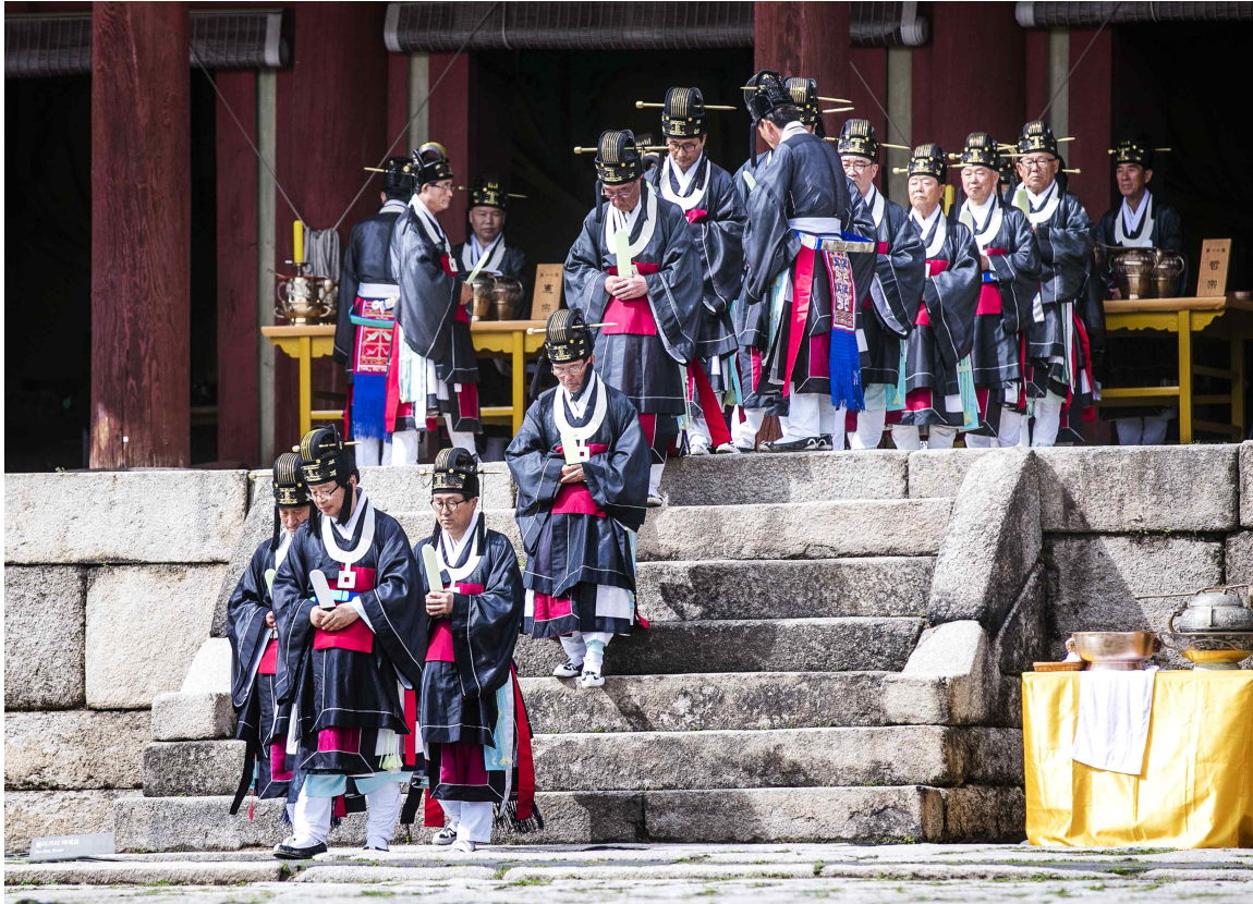
< 고유제(예시) >