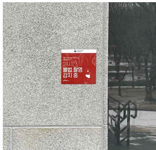
< 관람객 화장실 내·외부에 부착된 불법 촬영 경고 스티커 >