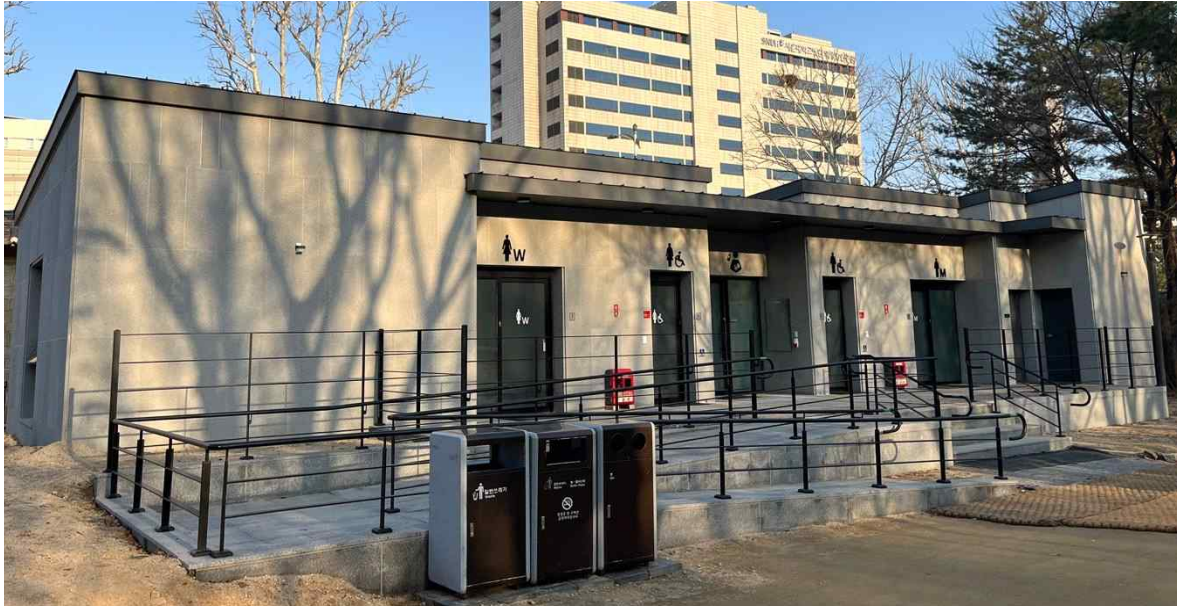
< 창경궁 내 신규 조성된 '안심 화장실' >