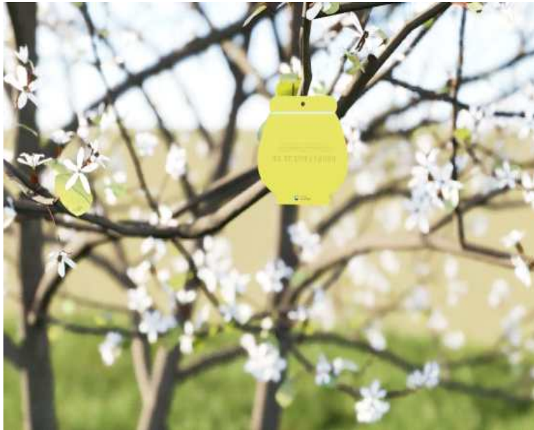
< 소원나무 (예시) >