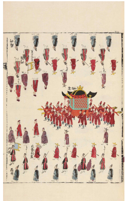
< 『종묘영녕전증수도감의궤』 반차도 속 “신여”, “향용장”, “신연” 부분 발췌 >