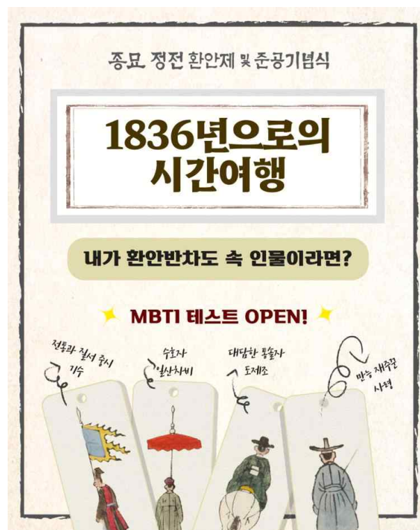
< '1836년으로의 시간여행 - 내가 환안반차도 속 인물이라면?' 대표 이미지 >